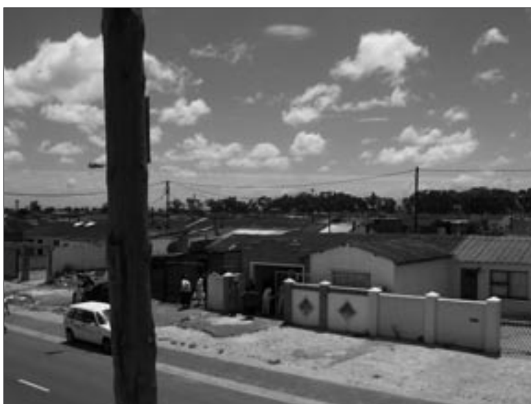
Blik op de nieuwe stenen huisjes in Nyanga, door bewoners zelf gebouwd ipv hun voormalige krotwoningen

Eind 2005 trof u bij de Nieuwsbrief in plaats van de gebruikelijke acceptgiro, het machtigingskaartje voor de Wilde Ganzen aan. Na al het geweldige nieuws over de