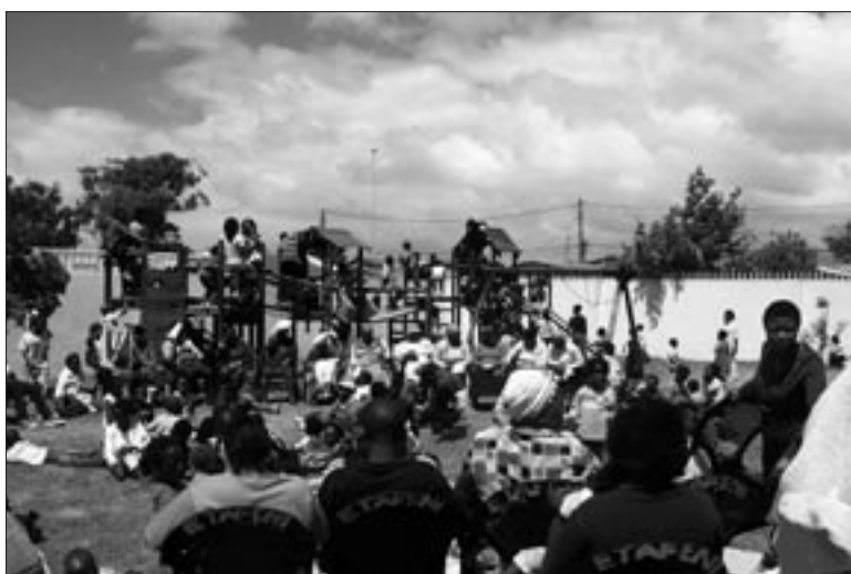
Feest ter afsluiting van het schooljaar

andere Dominicaner zuster haar rol zal overnemen, hoewel de Moeders het zonder hulp ook best redden. Maar het is lastig dat de Moeders niet over een computer met internetverbinding beschikken en ook geen fax hebben. We hebben wel een paar