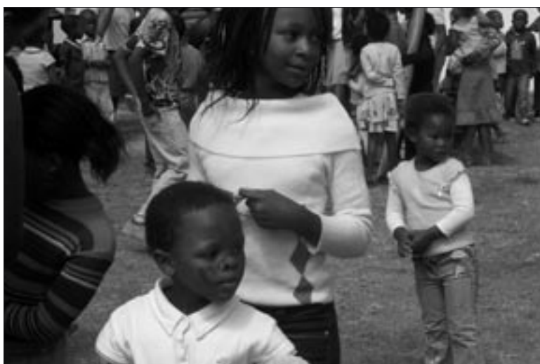
Peuters met zusjes en broertjes

We bedanken u voor uw geweldige medewerking aan de actie voor Etafeni, die zo schitterend afgesloten kon worden. We wensen u prettige kerstdagen toe en een goed, gezond en gelukkig 2007.