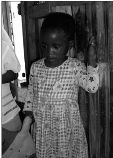
3 mei 2005: Een van de kinderen van Mkonto (Nyanga)

HET BESTUUR overweegt om de Mpumalanga Farmschools, die we vorig jaar met een gift gesteund hebben, ook dit jaar te steunen. We hebben hen gevraagd een bestedingsvoorstel te doen en zij vroegen of ze het