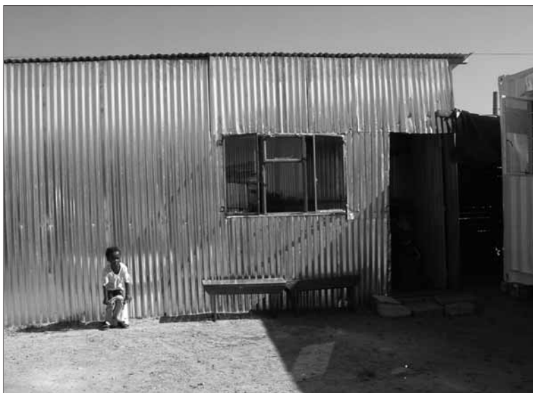
3 mei 2005: De nieuwe schuur voor de speelgroep