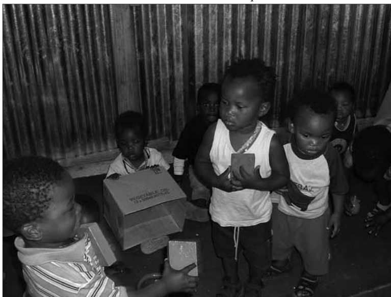
3 mei 2005: Mkonto kinderen in hun nieuwe speelschuur