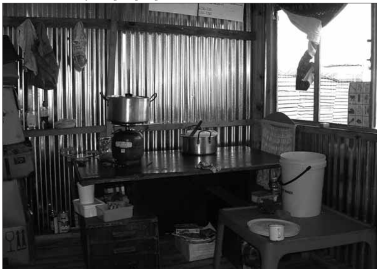
3 mei 2005: Keukenhoekje op de nieuwe Mkonto-speelgroep