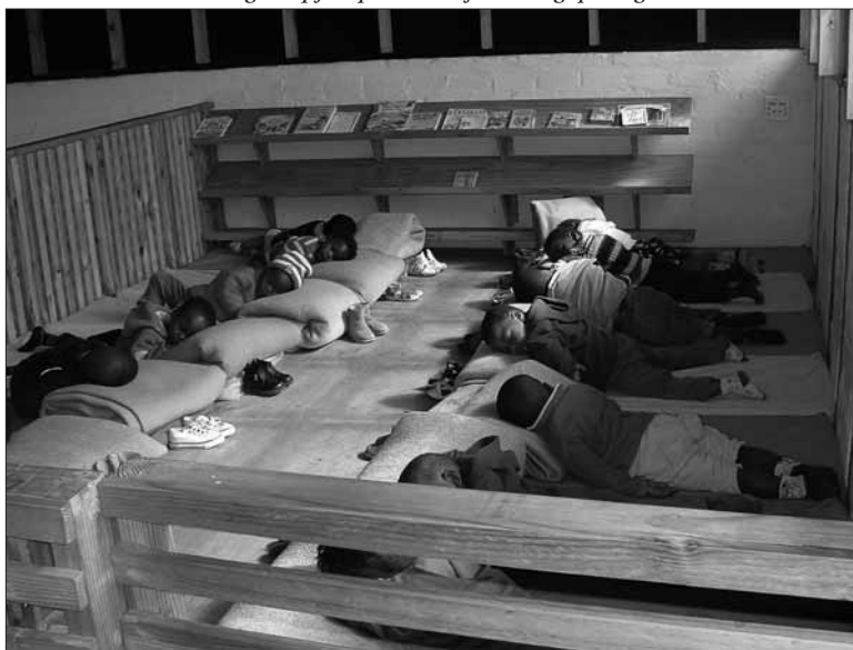
12 mei 2005: Middagslaapje op het Etafeni Dagopvang Centrum