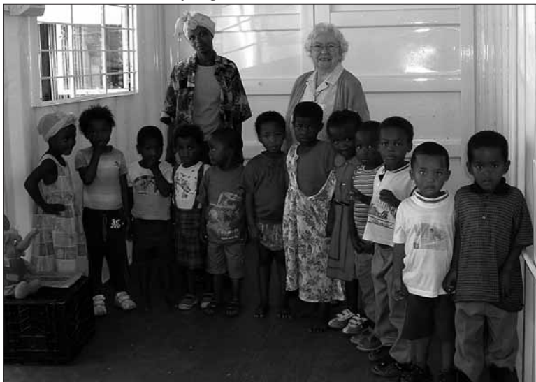
3 mei 2005: De 5- en 6-jarigen in de nieuwe Mkonto container