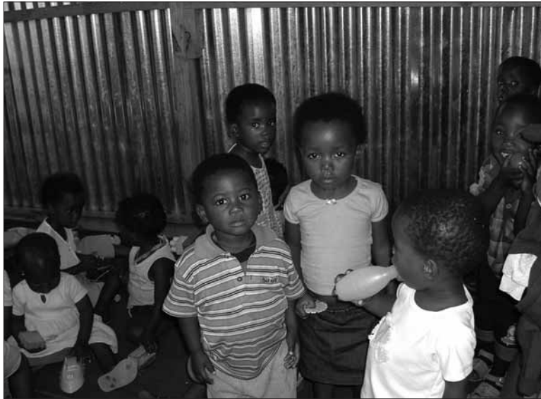
3 mei 2005: Etafeni speelgroep in Mkonto