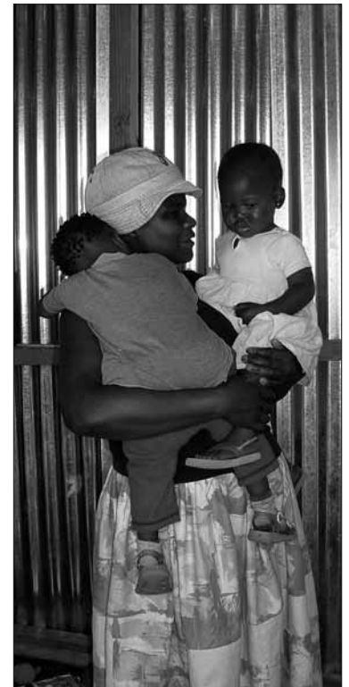
3 mei 2005: Nondzondelelo troost twee Etafeni-kindertjes

veel indruk op mij gemaakt. Vlak daarvoor waren wij elkaar namelijk in café De Peuk na jaren weer eens tegengekomen. We hebben toen heel erg lang zitten praten en dat was heel gezellig en we spraken af om af en toe weer eens contact op te nemen. Ik vond het toen heel bijzonder hoe het na zo'n lange tijd weer klikt, alsof je elkaar gisteren nog gezien hebt. Haar afscheid heeft mij aan het denken gezet en het fonds eigenlijk ook wel. Ik heb hiervan een beetje geleerd dat je soms meer spijt kan hebben van de dingen die je niet gedaan hebt, dan van de dingen die je wel gedaan hebt en ik probeer daar ook zoveel mogelijk naar te leven.'