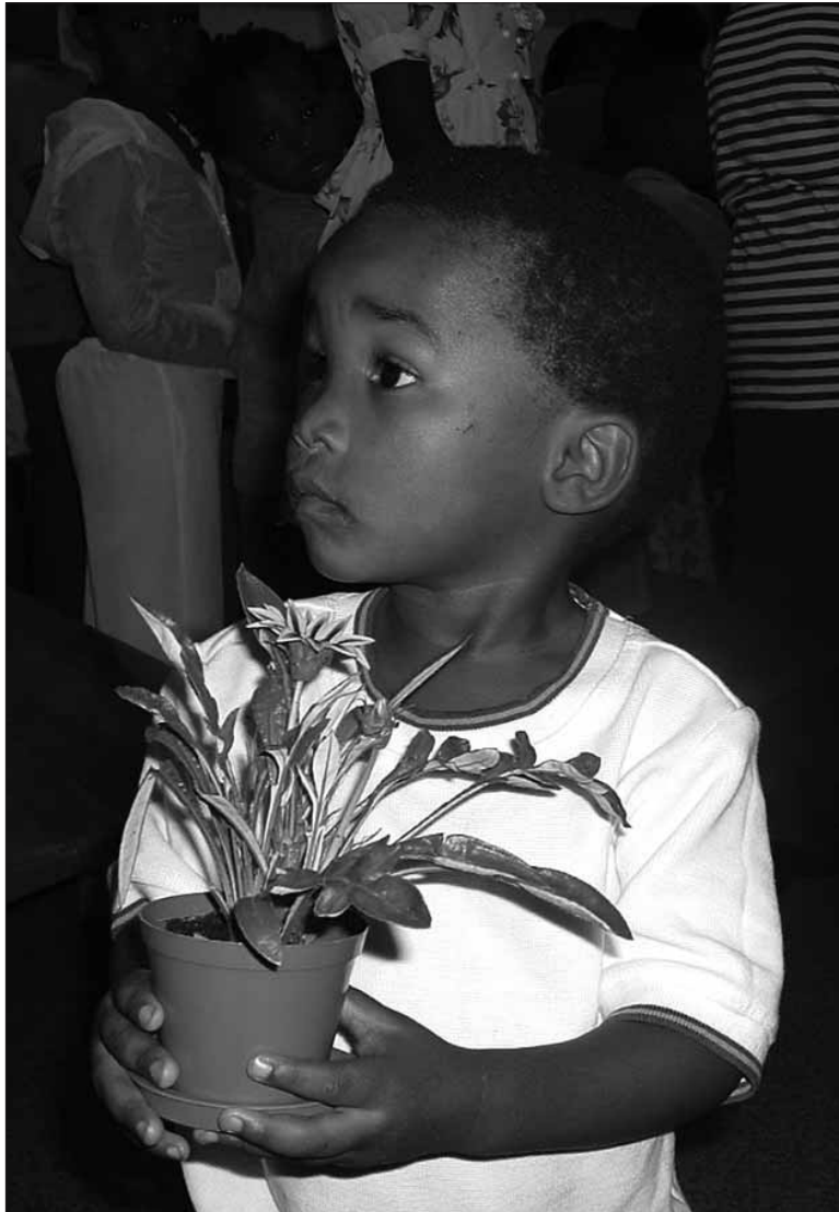
Vol verwachting (een klein kind in Nyanga)

bedoeling dat kinderen, die hun ouders aan AIDS hebben verloren, opgenomen worden in bestaande gezinnen van Nyanga.