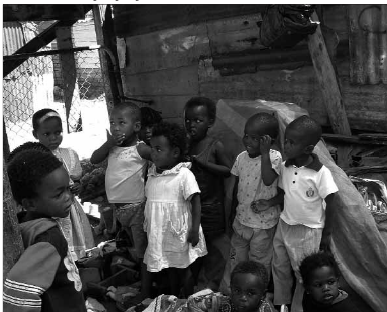
Kinderen uit de speelgroep Masizame