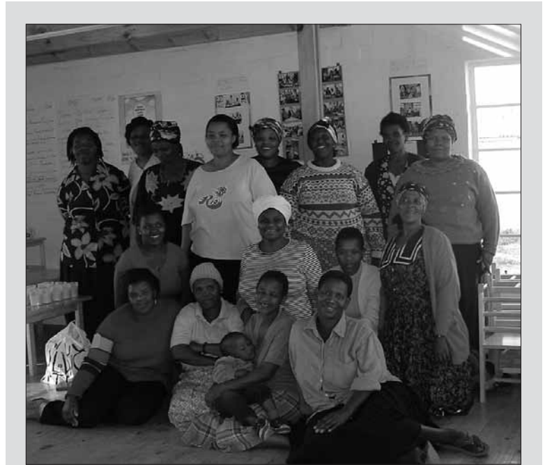
Etafeni-vrouwen bedanken het Marjolein Roskam Fonds voor de financiële steun