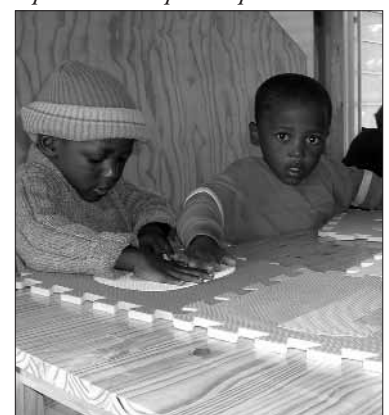
Op de nieuwe peuterspeelzaal