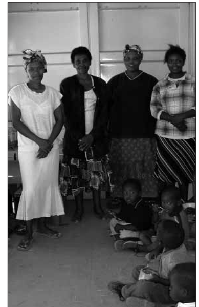
Vier van onze Etafeni-vrijwilligsters

ER IS DIT KEER ALLEEN nieuws over het Etafeni Project in de Kaapse krottenwijk Nyanga. We kregen wel aanvragen voor donaties, maar de gegevens waren te summier om daar op in te gaan. We blijven wel op zoek naar projecten die we naast ons vaste Etafeni Project met een eenmalige gift kunnen helpen bij de aanschaf van benodigd lesmateriaal e.d., waar zij met hun normale budget niet aan toe komen.