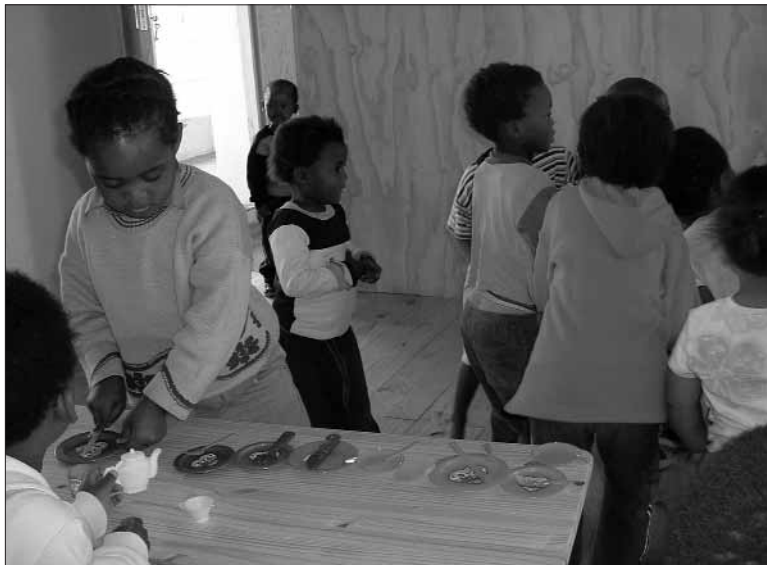
Op de thee genodigd