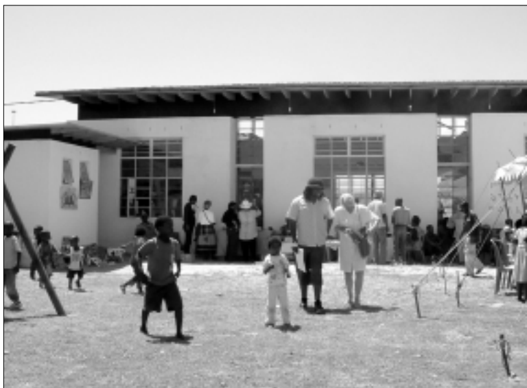
Het nieuwe peuterspeelgebouw met een speelplaats op gras.