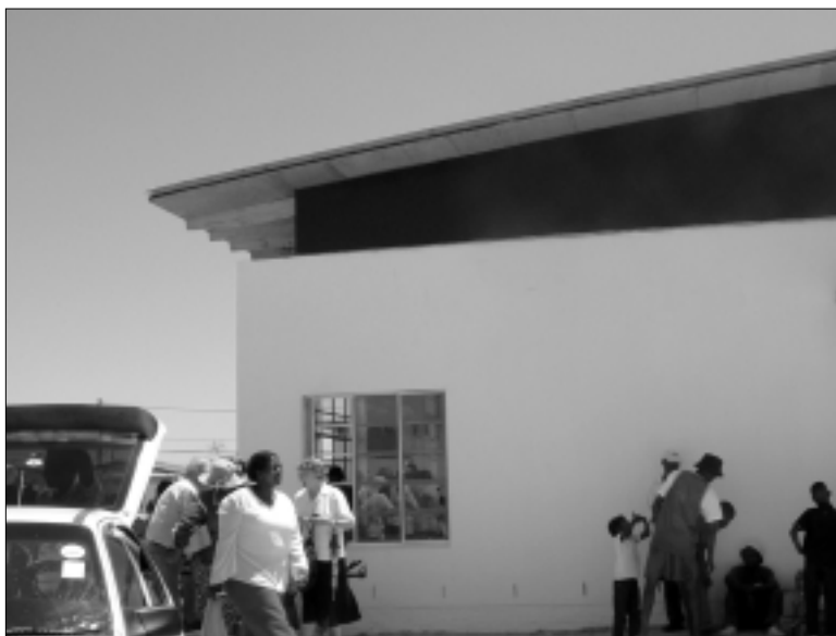
Zijaanzicht van het gebouw.