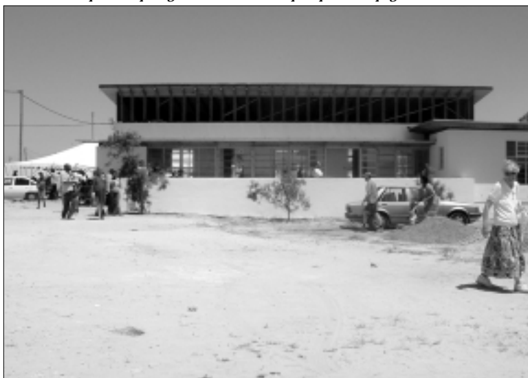
Vooraanzicht van het gebouw.