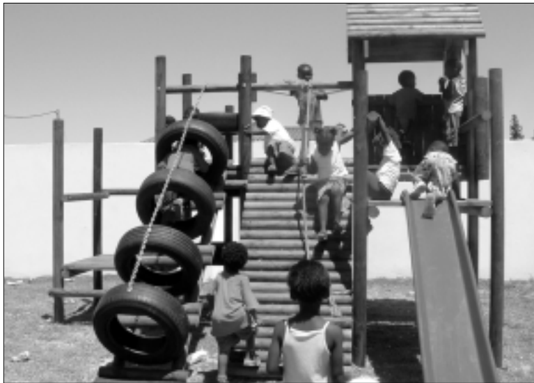
Etafeni kinderen op het nieuwe jungle gymtoestel.