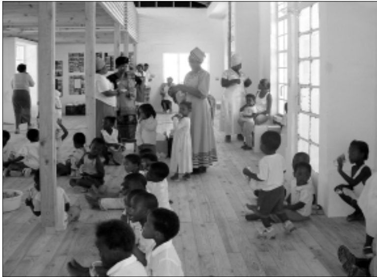
De kinderen en een paar van de Etafeni-moeders binnen de nieuwe peuterspeelzaal. Het is ruim en heel licht.