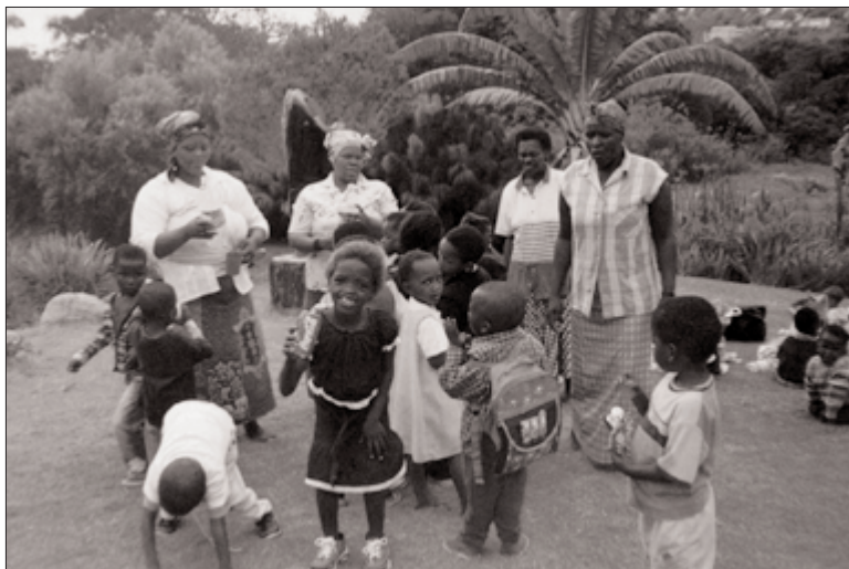
Vier Etafeni-moeders bezig met de kinderen in de botanische tuin Kirstenbosch