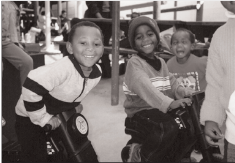
Dolle pret op de scootertjes van de speeltuin.