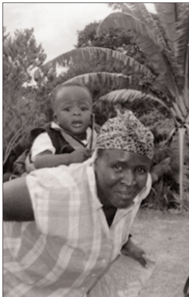
Schoolreisje naar Kirstenbosch.

Het dagverblijf moet flexibel van opzet zijn, de medewerk(st)ers hebben cursussen gevolgd over de aidsproblematiek, met name over de trauma's die kinderen oplopen bij het zien wegkwijnen van hun ouders/verzorgers en het alleen achterblijven na hun dood. Er komt een veilige en zonnige speelplaats met twee fonteintjes. Er wordt naar gestreefd er een plek van te maken dat model kan staan voor andere dorpsgemeenschappen, vooral in Zuidelijk Afrika.